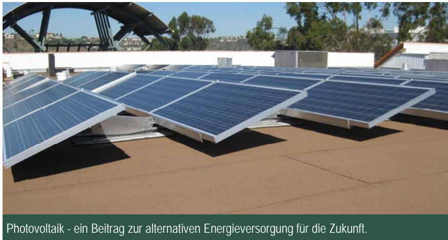
Photovoltaik - ein Beitrag zur alternativen Energieversorgung für die Zukunft.

Leider liegt wie bei so vielen Rezepten im Detail das Problem. Ohne viel Erfahrung und Wissen bei der Aus-