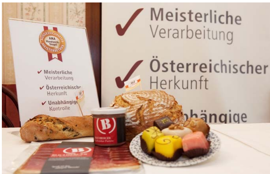
Das AMA-Handwerksiegel zeichnet die meisterlichen Fachgeschäfte von Bäckern, Konditoren und Fleischern aus.

Es zeichnet nicht die einzelnen Produkte aus, sondern das angeschlossene Fachgeschäft zum Produktionsbetrieb.